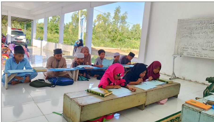
Gambar 3. Antusias Santri Belajar Tajwid dengan Buku Saku Tajwid Dengan didampingi oleh Pengajar

Oleh karena itu, para pengajar sepakat dan ingin membuat buku saku yang berupa ringkasan tajwid dengan rangkaian kalimat yang sederhana agar santri di TPA mudah memahami dan juga dapat belajar dan mempelajari sendiri pada saat di rumah. Para santri sangat senang dan antusias membaca materi pada buku saku tersebut. Semua santri membaca dan mempraktikkan bacaan yang terdapat di buku saku tersebut dengan tetap didampingi oleh pengajar.