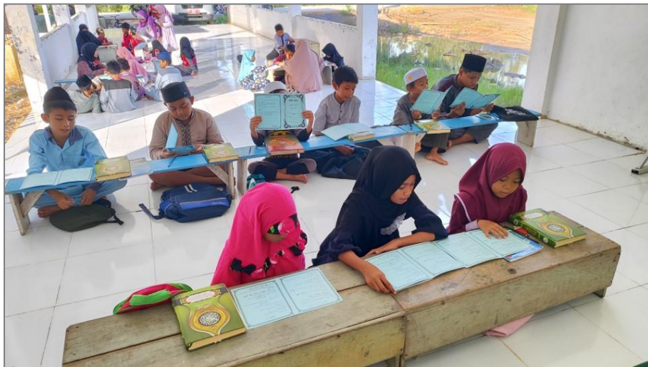
Gambar 3. Penerapan dan Penggunaan Buku Saku Tajwid Sebagai Media Ajar Tajwid