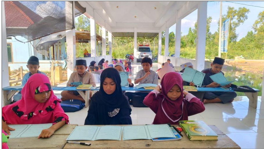
Gambar 3. Pembagian Buku Saku Tajwid

Kegiatan Pembagian dan Penerapan Buku Saku Tajwid , muatan materi yang telah disederhanakan oleh pengajar, kemudian dibentuknya format materi ke dalam bentuk buku saku yang sederhana, tipis, mudah dibawa dengan tetap memuat materi yang berkualitas sesuai hukum tajwid dan contohnya.